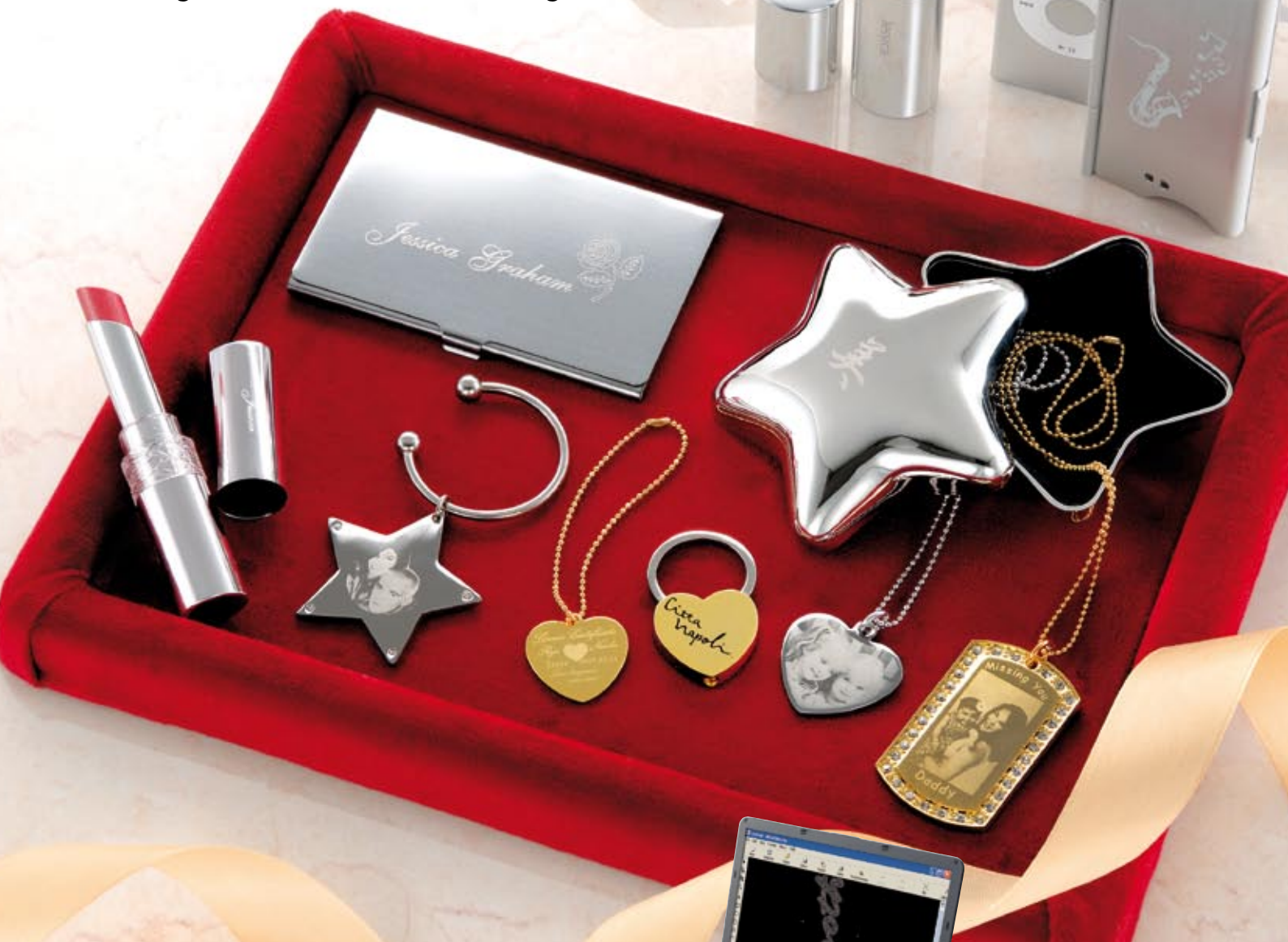
PHOTO IMPACT PRINTER METAZA MPX-80

D er MPX-80 Fotogravurdrucker macht aus normalen Geschenke und Werbematerialien schnell mit Stolz gepflegte Andenken. Kreieren Sie individuelle Geschenke für besondere Gelegenheiten – anfangen bei Hochzeiten und Jubiläen bis zu Geburtstagen und Promotionen. Produzieren Sie einzigartigen Schmuck mit Familienfotos von Ihren Kindern und Hunden. Einzigartige personalisierte Preise und Geschenke verstärken die Wirkung ihrer Geschäftsveranstaltungen.