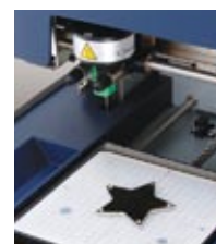
2 Secure item in place