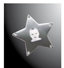
3 Press Print